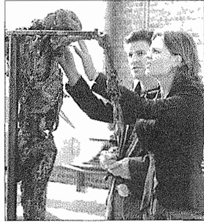
David Boreanaz y Emily Deschanel.

En la primera, Brennan y Booth acuden a la escena de un crimen en la azotea de un hotel. Allí se encuentra el cuerpo de un hombre mutilado, quemado y colgado de un poste. Brennan encuentra entre los restos y unido a la garganta de la víctima una ficha con su identidad. Se trata de un ex agente del FBI que además posee una extraña moneda en la que está acuñado el rostro de Colón. Este asesinato puede estar relacionado