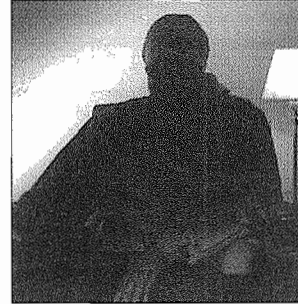
'De profesión: matón'.

De profesión: matón. es un reportaje de EL MUNDO TV que descubre cómo trabajan, qué tipo de personas se contratan, cuánto cobran y qué métodos emplean (palizas, secuestros, asesinatos...) para cumplir con su cometido.